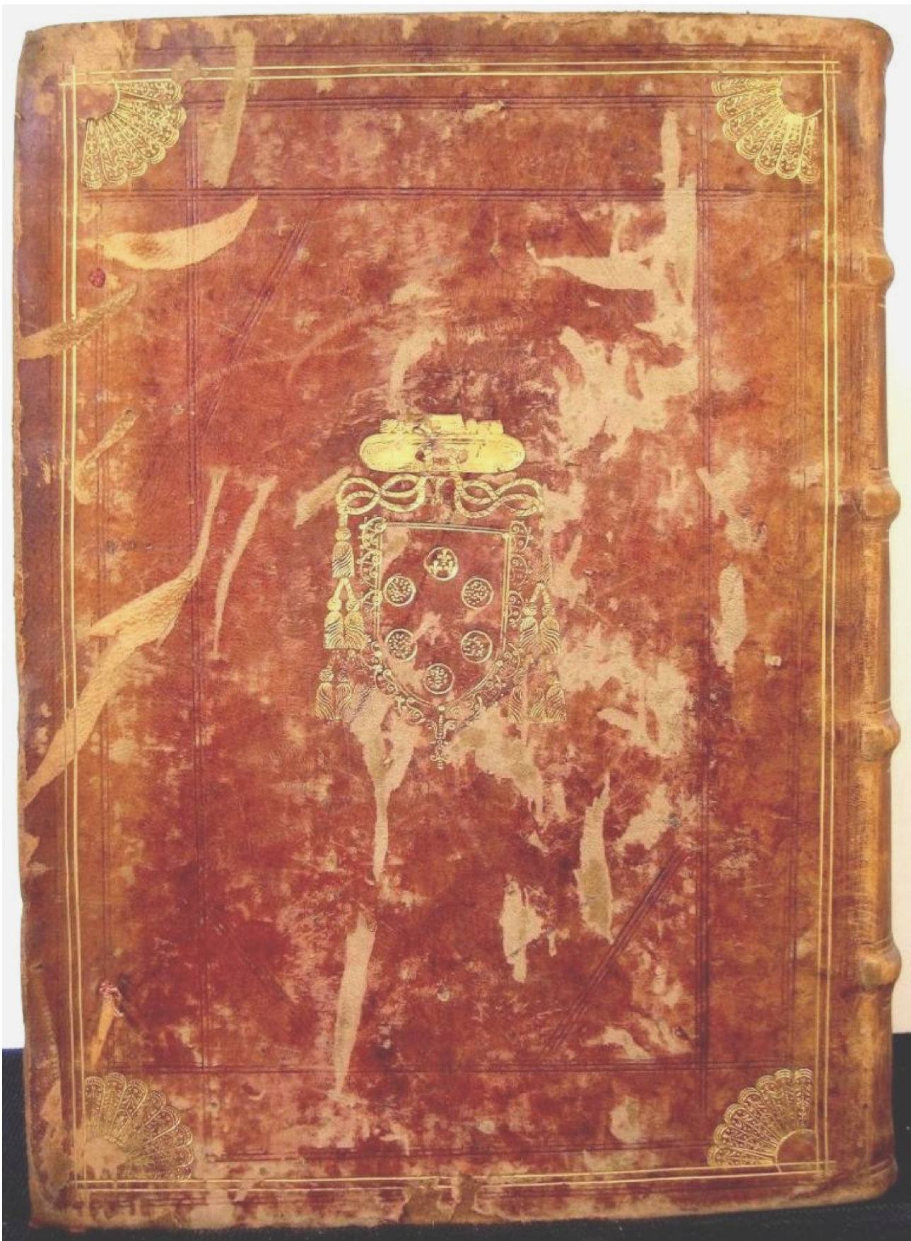
1 Piacenza, Biblioteca civica Passerini Landi, (C)D'.II.19 - (C)D'.II.20, I. Caesaris Claudini ... Empyrica rationalis libri 6 absoluta, et in duo volumina diuisa, in quorum primo uniuersi corporis humani affectus, penes totum, & partes; in altero vero penes speciem, indiuiduum, aetates, causas manifestas, recitati commissa, cui ut faciliori negotio medicinam facientes, quicquid in opere continetur, inueniant, praeter annotationes in margine, geminus accessit index Io. Caroli Matthesilani ... Opus medicis, chirurgis, & secreta profitentibus apprime proficuum , Bononiae, typis Iacobi Montij, 1653 (Bononiae, ex typographia Iacobi Montij, 1653).