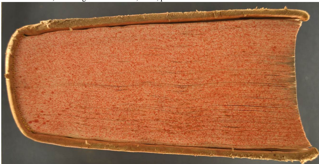
4 A.IV.C.III.12 1-2, taglio di piede.