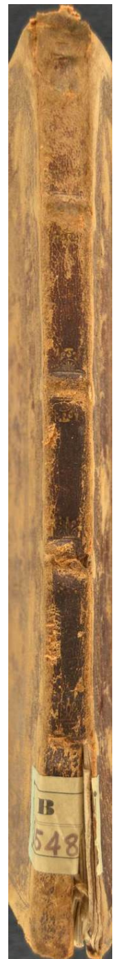
Bologna, Biblioteca civica dell'Archiginnasio, B 2548, Formula di promissione e di giuramento per i magistrati di Bologna , ms. membranaceo XVIII secolo